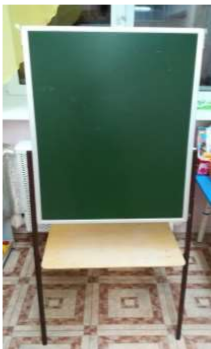
Мольберт с магнитной доской