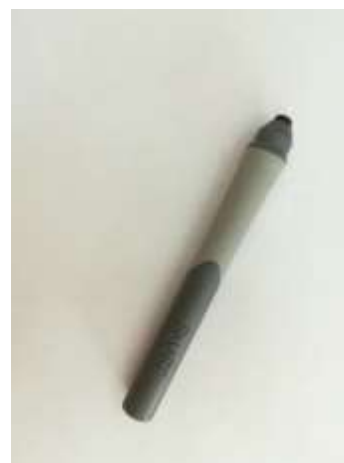
Маркер для SMART BOARD