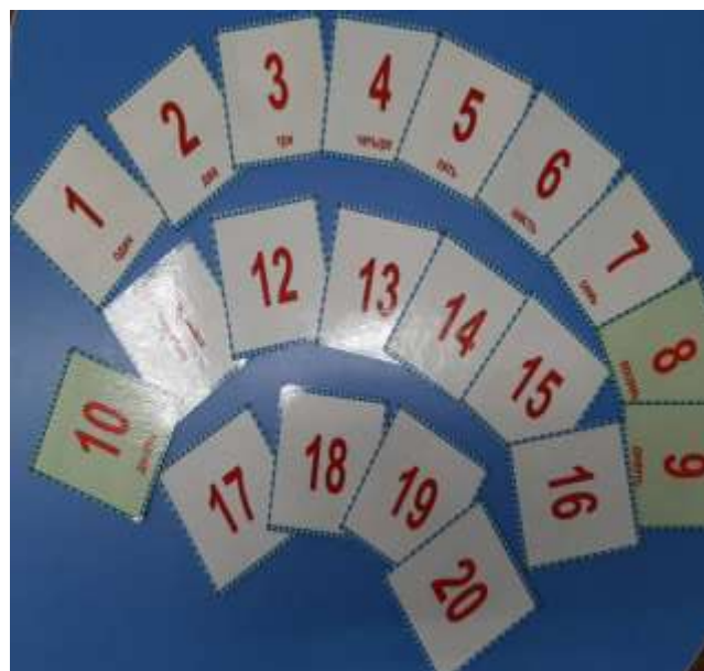
Цифры от 1 до 20