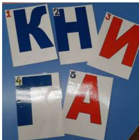
Буквы с заданиями